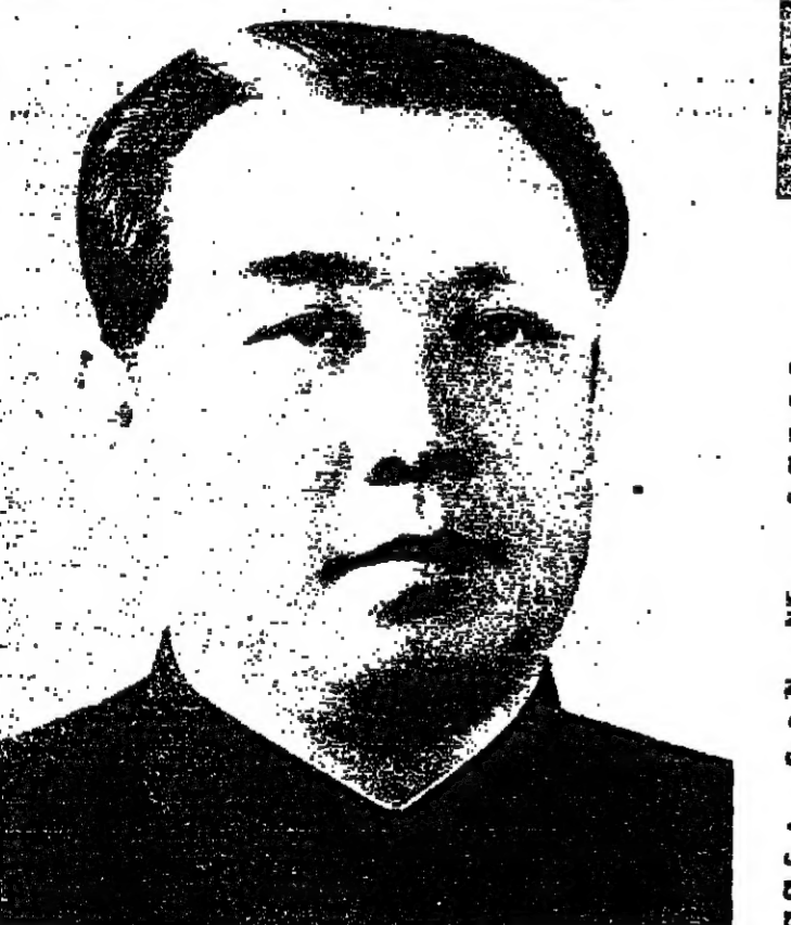
الرئيس كيم ايل سونغ

قل في غمته انها كانت ملكة ، ذلك انه ظن ان امراته وهوسها بين يدي ريسه ، من ولي بلسم المسيح ما كانت يوما مستعملا بل اكبر نمل حرة . ذلك ان من يدرس بها على هذا الوجه يدرس بها عن اقتناع تام وحرية مطلقة . وهذه هي البطولة الكبرى التي